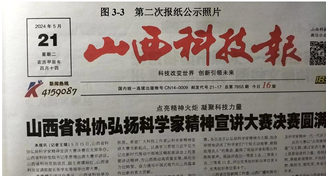
图 3-3 第二次报纸公示照片